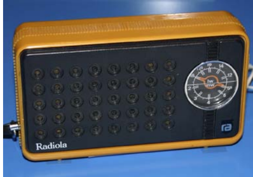
Musée de Radio France, inv. 2221

01 Durant les évènements de mai 1968, quel est donc cet objet que les étudiants transportaient collés à leur oreille ?