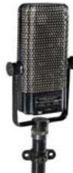
Musée de Radio France, inv. 652