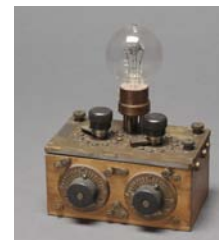
Cnam, inv. 21554

02 Que désignent les initiales PU sur le bouton, et à quoi sert ce dispositif ?