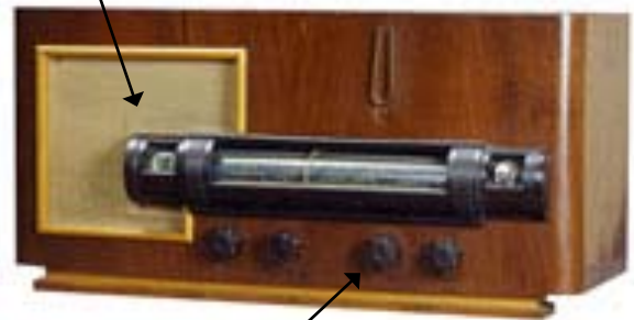
Cnam, inv. 21562