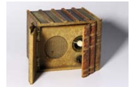
Musée de Radio France, inv. 450

03 Un jour à la radio anglaise, la BBC, on entendit un message codé qui disait « bercent mon cœur d'une langueur monotone ». Ceux qui l'entendirent reprirent espoir, la fin de la guerre était proche. A l'origine, qui a écrit ces mots ? Que pouvait bien signifier ce message?