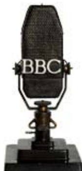
Musée de Radio France, inv. 2086

04 À quels pays appartiennent les deux micros suivants ?