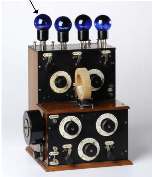
Musée de Radio France, inv. 77